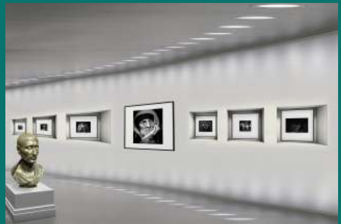
VIRTUELE TOUR MUSEA