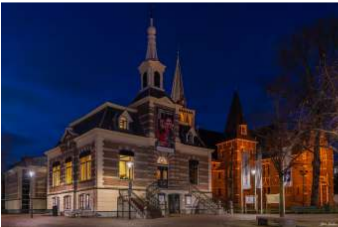
Hilversum museum

Dit is een Nederlandse journalistieke fotografiewedstrijd. De expositie toont foto's uit verschillende categorieën, van nieuws en documentair tot politiek en entertainment.